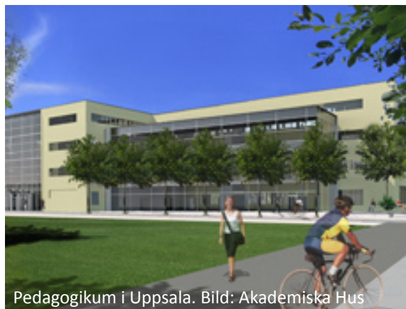
Pedagogikum i Uppsala.

Alla byggnader har utformats med fokus på högsta energieffektivitet. Helvars helhetslösning för belysning med små lokala system för mindre kontorsrum, lärosalar och mindre korridoravsnitt till ett nätverksanslutet system för allmännyttor, bibliotek och matsal installeras. I båda fallen används DALI protokollet för att kunna, fullt ut, tillgodose alla behov.