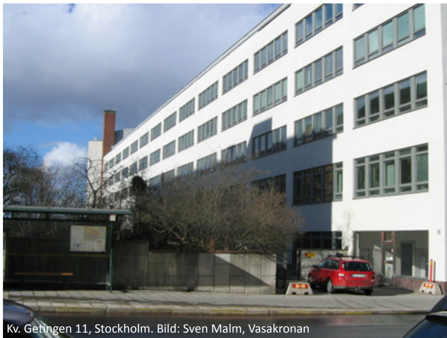
Kv. Getingen 11, Stockholm.

mätningar genomförts avseende dagsljusinlänkning och ljusreglering. Dessa genomfördes vid dagsljuslaboratoriet på Lunds Tekniska Högskola under ledning av Helena Bülow-Hübe.