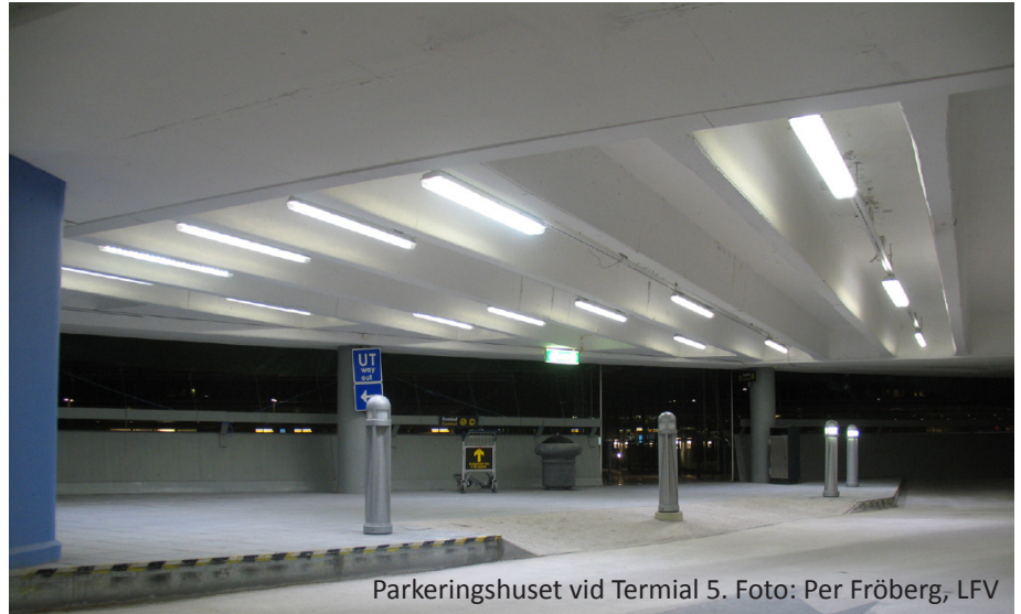
Parkeringshuset vid Terminal 5.

des, så ökar ljusmängden med LED-belysning med tio procent.